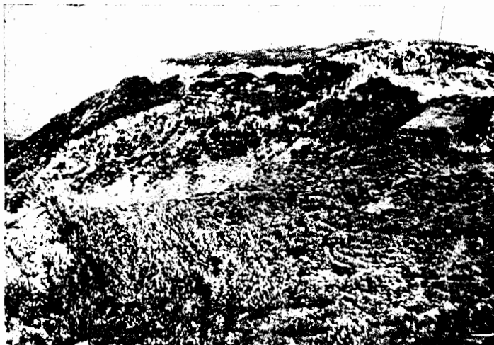
Fig. 16. Daulis. D'après L. Robert, BCH 59 (1931) pl. XI