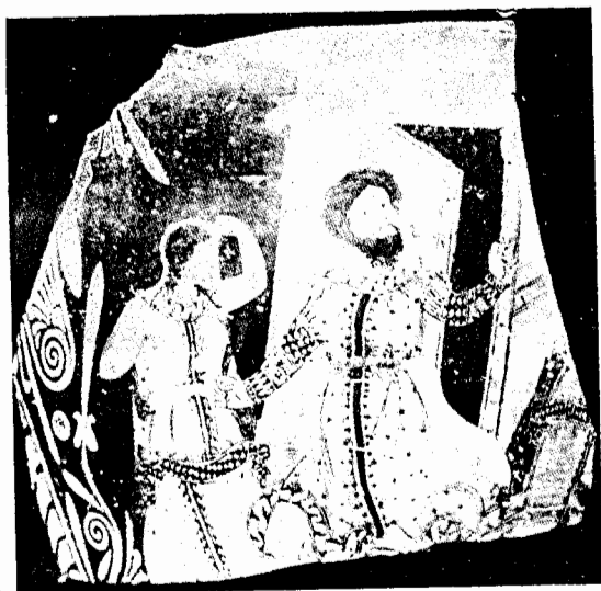
Fig. 8. Fragment de vase provenant de Paestum. D'après Bieber, Ath. Mitt. 50 (1925) pl. II