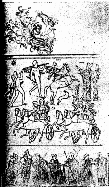
Fig. 9. Vase provenant de Ruvo. D'après Reinach, Répertoire des vases peints I, 240