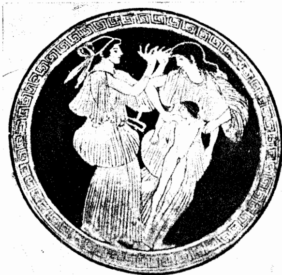
Fig. 5. Cylinx provenant d'Etrurie. D'après Pottier, Vases antiques du Louvre, t. III G 147 pl. 118