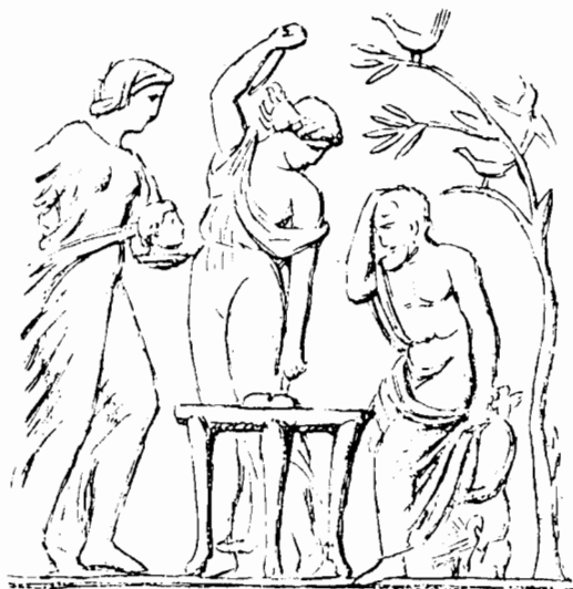
Fig. 13. Intaille en grenat d'Orient