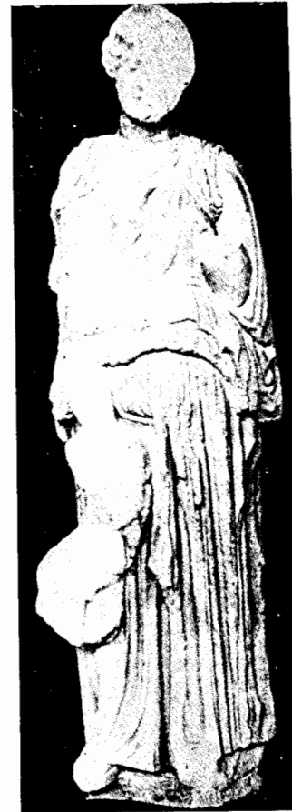
Fig. 3. Groupe attribué à Alcamène. D'après Praschniker, ÖJh. 16 (1913) pl. III