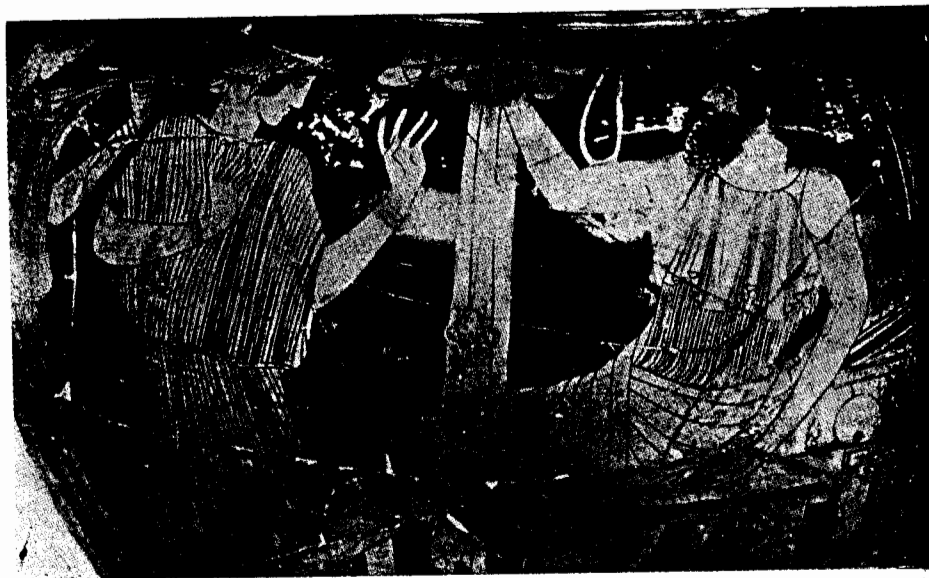
Fig. 7. Le même cratère (voy. fig. 6), détail. Ib. pl. 17 n. 3