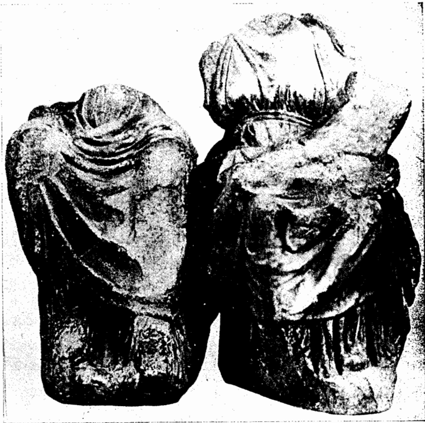
Fig. 2. Le même groupe (voy. fig. 1). Ib. fig. 8