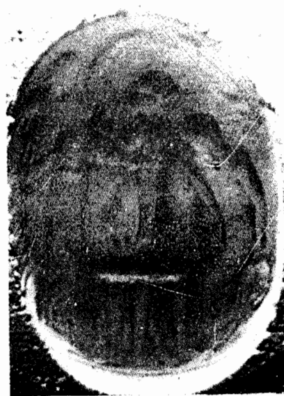
Fig. 14. La même intaille (voy. fig. 13). Moulage