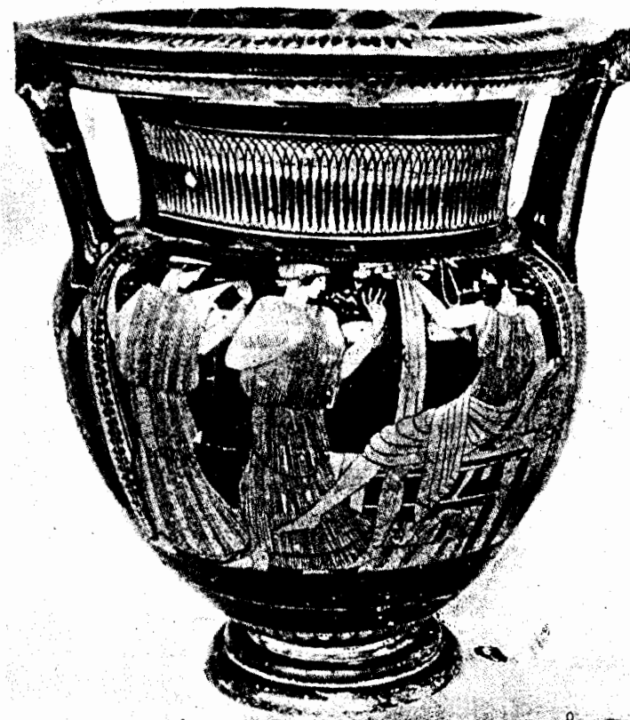
Fig. 6. Cratère trouvé à Falerii veteres. D'après Corpus vasorum Italia, fasc. 2 (Villa Giulia, fasc. 2) III, 1c pl. 17 n. 1