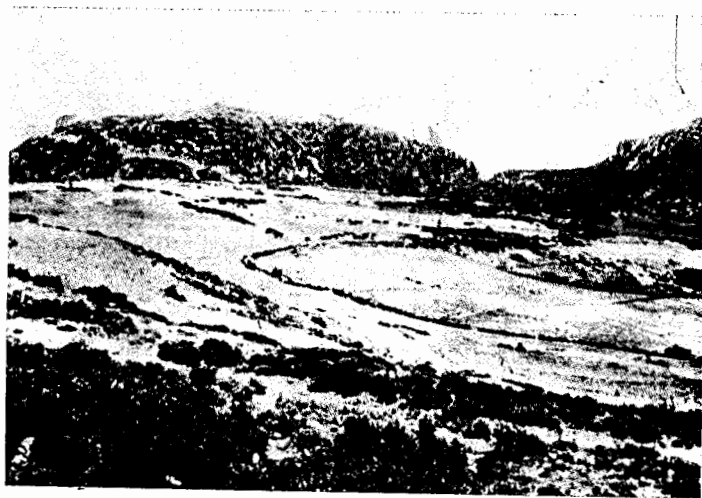
Fig. 17. Daulis. Ib. pl. XI